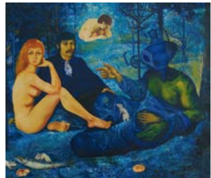
Helmut Leherb, Déjeuner chez Leherb , 1965-67

Wolfgang Hutters Bilder lassen auf geheimnisvolle Bühnen blicken. Hier sieht alles künstlich aus, wie eine „Szenerie, die aus Plastik und Papiermaché, aus Marmorschiff und Krepp-Papier, aus Bändern und Perlen gemacht ist“ (Johann Muschik). Ein frühes Hauptwerk Hutters ist das Bild Theater , das die Welt des schönen Scheins in allen Facetten schildert. Auch in vielen Bildern von Helmut Leherb präsentieren sich die Protagonisten wie Darsteller auf einer Bühne. Die Figuren erscheinen bizarr und surreal und stellen kühne metaphorische Zusammenhänge her. Auch in Ernst Fuchs' Bildern finden sich immer wieder Figuren, die wie auf einer Bühne bedeutungsvoll deklamieren. Rudolf Hausners komplexe Bildthemen erscheinen vielfach rätselhaft, labyrinthisch. Ein Bild Hausners trägt den Titel Labyrinth . In dieser Darstellung bilden für einen heranwachsenden Knaben die „Schächte der Vergangenheit“ eine tiefgründige Bedrohung. Die Rätselhaftigkeit des Labyrinths, die bereits im Manierismus ein Lieblingsthema der Künstler war, wird von den „Phantasten“ eingehend thematisiert.