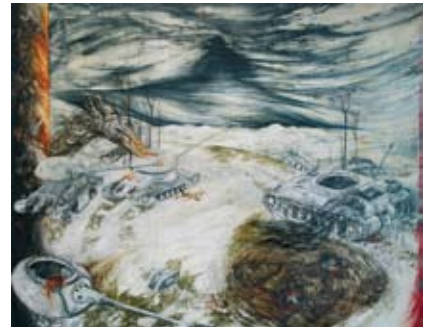
Anton Lehmden, Panzerschlacht (Kriegsbild III), 1954-56