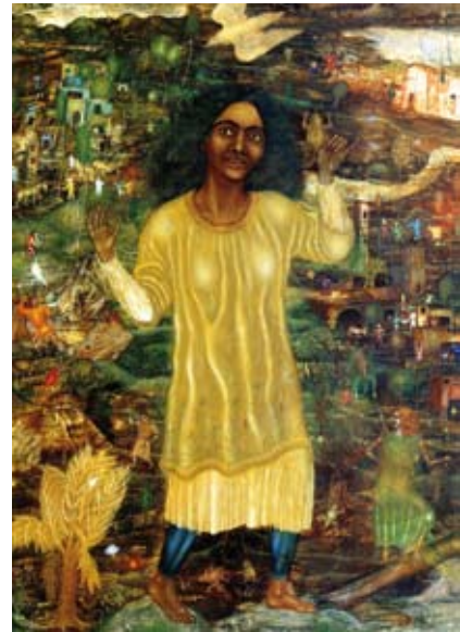
Arik Brauer, Tanzende Braut, 1956/57