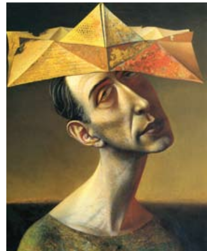
Rudolf Hausner, Gelber Narrenhut , 1955

Der 1887 in Wien als Albert Konrad Kiehtreiber geborene Maler, Schauspieler und Dichter Albert Paris Gütersloh repräsentiert wie kein anderer die Kontinuität phantastischen Denkens in der Moderne Österreichs. Über zwei Weltkriege hinweg lebte er eine künstlerische Haltung, die sich der „Phantasmagorie“ verschrieben hatte. Vor seiner Karriere als Maler wirkte er als Schauspieler. 1909 schloss er sich der „Neukunstgruppe“ um Egon Schiele an. 1911 erschien sein expressionistischer Roman Die tanzende Törlin . Nach einer Professur an der Kunstgewerbeschule 1930-38, die ihm die Nationalsozialisten entzogen, wurde Gütersloh 1945 an die Wiener Akademie der bildenden Künste als Leiter einer Meisterschule für Malerei berufen. Hier studierten Ernst Fuchs, Arik Brauer, Wolfgang Hutter und Anton Lehmden im berühmten „Turmatelier“. Als Präsident der Wiener Secession und des „Art Clubs“ spielte Gütersloh eine zentrale Rolle in der Zeit des Entstehens des Phantastischen Realismus. Gütersloh starb 1973 in Baden bei Wien.