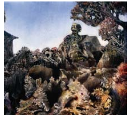
Max Ernst, Das Gastmahl der Sphinx , 1940

Anton Lehmdens Landschaften erscheinen als Capriccios in der Tradition manieristischer Übersteigerung. Sie erzählen von absonderlichen Facetten der Natur und stecken voller Anekdoten. Die Landschaft gebärdet sich als bizarre Akteurin: „Sie spaltet sich, explodiert vulkanartig, stößt Teile aus, sie speit Erdschollen in die Lüfte, sie gebiert Landstücke, Ableger, sie entlässt sie in den Raum, wo sie ruhig durch die Luft segeln“ (Alfred Schmeller). Die Phantasie des Künstlers verbindet sich mit dem registrierenden Blick eines Kartografen, der die Phänomene der Erdoberfläche exakt festhält. Zuweilen finden sich auch merkwürdige Fremdkörper in der Natur, kristalline Edelsteine und visionäre Erscheinungen. Gleichsam phantastisch wirken auch die Landschaftsbilder Arik Brauers. Übersät mit einer Vielzahl von Figuren und Kreatürlichem konfrontieren sie den Betrachter mit einer unüberschaubaren Fülle von Eindrücken. Wolfgang Hutterers Landschaften scheinen hingegen wie gepflegte Gärten, in denen jedes Pflänzchen, jedes Blatt seinen festen Platz hat.