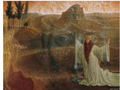
Ernst Fuchs, Moses vor dem brennenden Dornbusch , 1956/57

Im Symbolismus um 1900, in der italienischen „Pittura metafisica“, im Surrealismus und im Magischen Realismus der Zwischenkriegszeit beschäftigten sich Künstler mit der Tradition des Magischen, des Phantastischen und des Traumbildes. Von 1930 bis in die 1950er Jahre wurde diese Tradition durch die politischen Diktaturen, aber auch durch dogmatische Tendenzen innerhalb der Moderne oft an den Rand gedrängt. Mit dem Erscheinen von Gustav René Hockes Die Welt als Labyrinth 1957 wurde jedoch deutlich, dass die „andere“ Moderne das unausweichliche zweite Gesicht der gesamten modernen Kultur darstellt. Die Wiener „Phantasten“ bezogen sich immer wieder auf diese Tradition. Der Symbolismus eines Odilon Redon oder eines Gustave Moreau zeigt die gleichen „All over“-Wucherungen, die auch Arik Brauer und Ernst Fuchs beschäftigten. Alfred Kubin setzt dämonische Wesen in ebenso unwirkliche Landschaften, wie es Jahrzehnte später Anton Lehmden praktiziert. Rudolf Hausner beschäftigt sich vor allem mit Bildmotiven des Surrealismus und der „Pittura metafisica“.