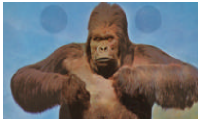
Videorama. Kunstclips aus Österreich – Best of 6. November 2009 – 24. Jänner 2010, halle 2