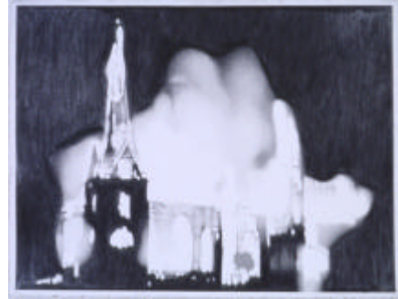
Fahrstuhl zum Schafott. Banks Violette & Miles Davis, Dashiell Hammett, John Huston, Weegee 20. März – 3. Mai 2009, halle 1