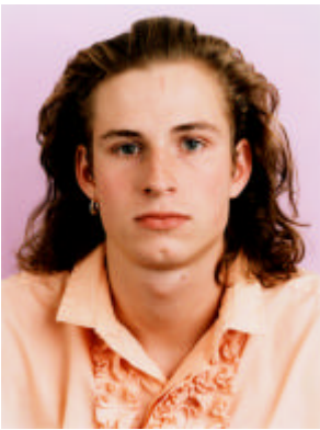
Thomas Ruff. Oberflächen, Tiefen 21. Mai – 13. September 2009, halle 1