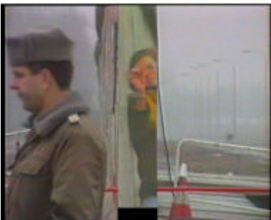
1989. Ende der Geschichte oder Beginn der Zukunft? Anmerkungen zum Epochenbruch 9. Oktober 2009 – 7. Februar 2010, halle 1