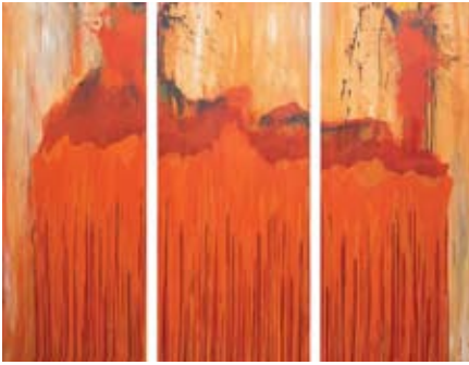
O.T. Triptychon 170 x 220 cm