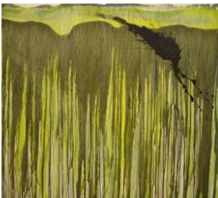
O.T. 145 x 160 cm