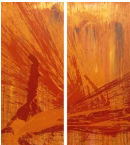
O.T. Diptychon 170 x 140 cm