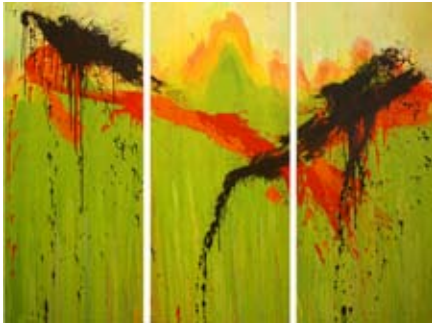
O.T. Triptychon 170 x 220 cm